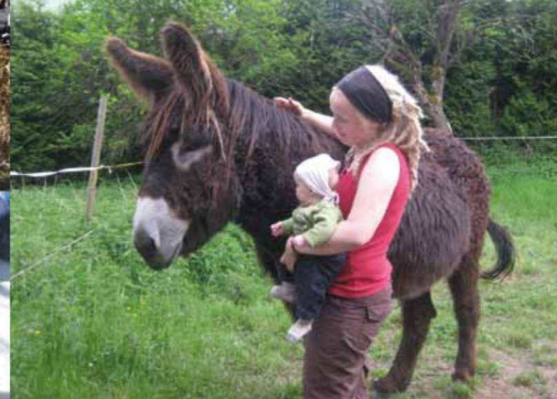
Die beiden Poitou-Esel befinden sich noch in der Ausbildung zu Therapietieren.