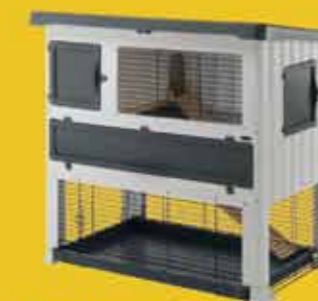
GRAND LODGE PLUS 120/140