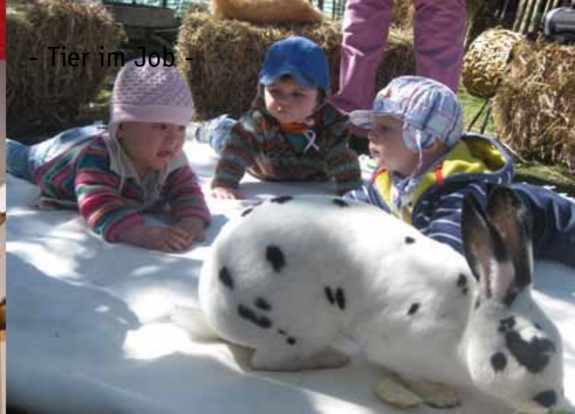
Schon die Kleinsten erlernen den natürlichen Umgang mit Tieren.