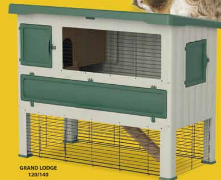
GRAND LODGE 120/140