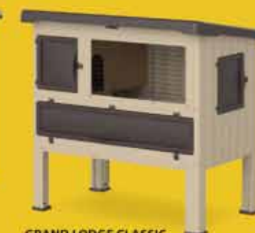
GRAND LODGE CLASSIC 120/140